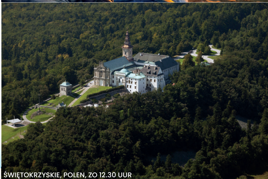
ŚWIĄTOKRZYSKIE, POLEN, ZO 12.30 UUR