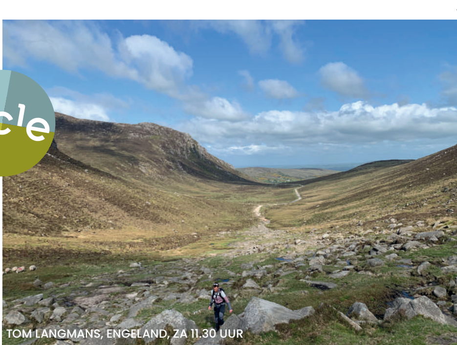
TOM LANGMANS, ENGLAND, ZA 11.30 UUR